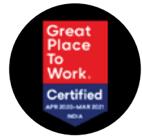
Great Place to Work Certified en India