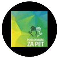
Top 4 Mejores Empleadores en Croacia