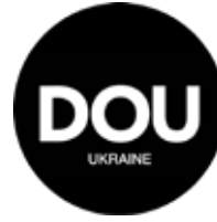
Top 3 Compañías IT en Ucrania