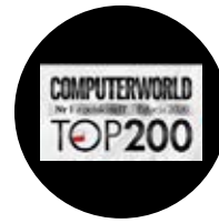
1º Puesto Computerworld TOP 200