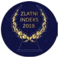
1º Puesto Zlatni indeks en 2019