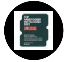
Top Employer Revista Focus