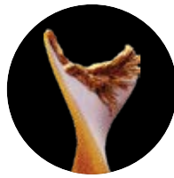
1º Puesto Koszaliński Orzeł 2019 en Economía